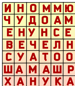
на третьей странице

Обсудите, как каждое из слов связано с праздником Ханука.